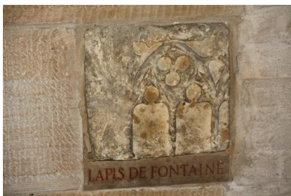
La pierre de la Maison natale à Spire