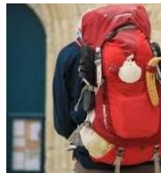
Un jacquet © Anne Lambert