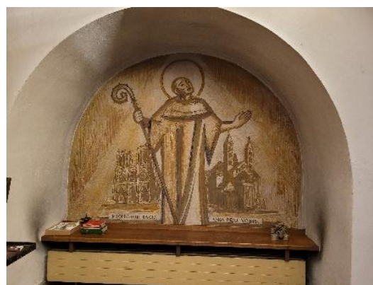
Saint Bernard dans l'église de la paix Saint-Bernard