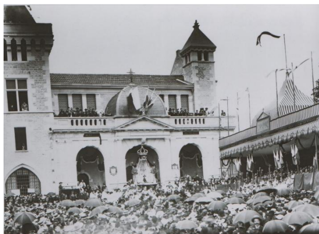
Les solennités le 17 juin 1891 sur la place devant la Maison natale