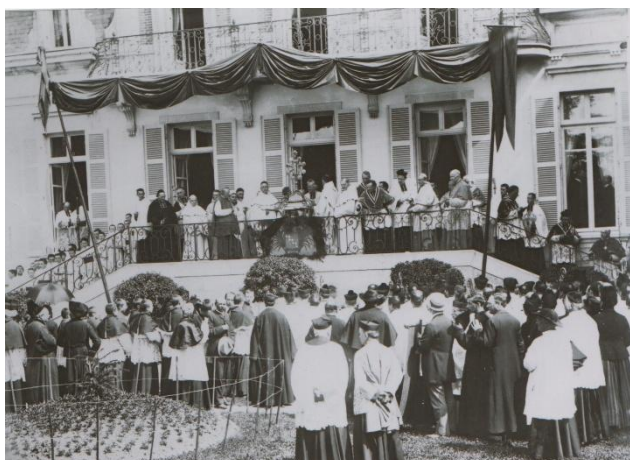
Le point de rendez-vous de la procession du 17 juin 1891