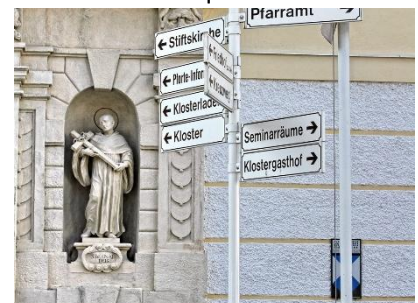
Saint Bernard en Autriche