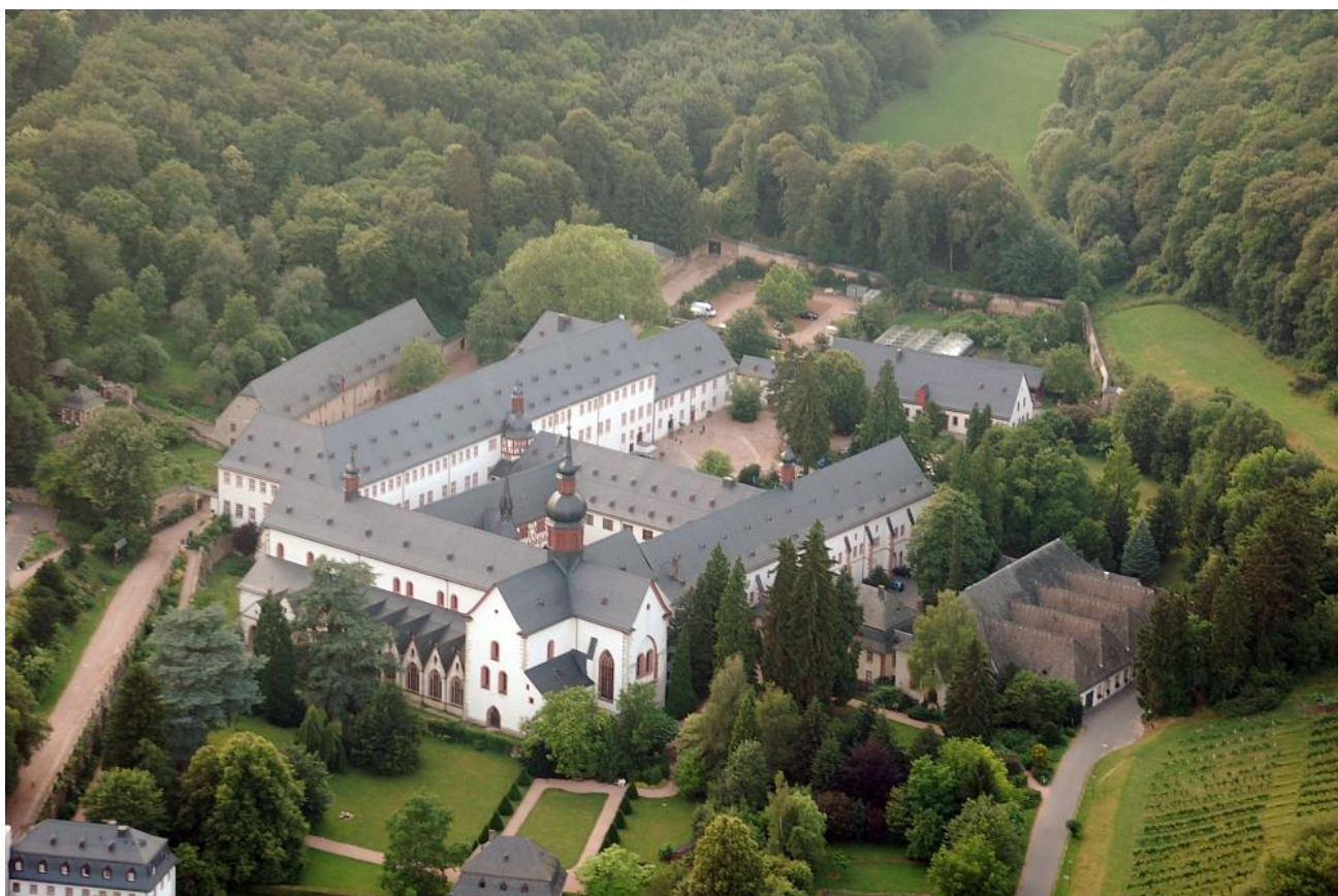
Vue aérienne de l'abbaye d'Eberbach en Allemagne