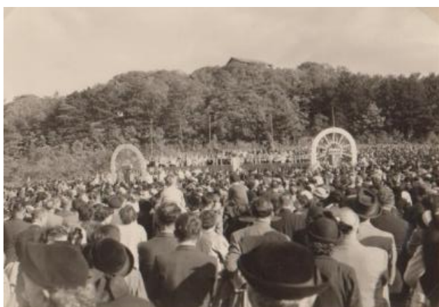
20 septembre 1953, la foule dans le clos des Feuillants

messe réunit les fidèles sur la place des Feuillants et l'après-midi se déroule une fastueuse procession de Dijon à Fontaine aux cris de « saint Bernard, donnez-nous la paix ». Toute la chrétienté semble rendre hommage au pacificateur de l'Europe. Le cortège comprend des délégations de catholiques allemands et ukrainiens 32 , des chevaliers du Saint-Sépulcre conduits par le prince de Salm pour les Allemands, des pères abbés cisterciens du monde entier et, aux côtés des autorités civiles françaises, les ambassadeurs de Belgique, de Hollande, du Canada ainsi que le consul d'Italie. Le contexte est en effet bien différent de 1891. En 1953, l'Église de France ne fait plus face aux fortes tensions avec l'État républicain qui mèneront à la loi de séparation de 1905. La procession de Dijon à Fontaine peut se dérouler avec la participation d'autorités civiles alors qu'elle avait été interdite en 1891.