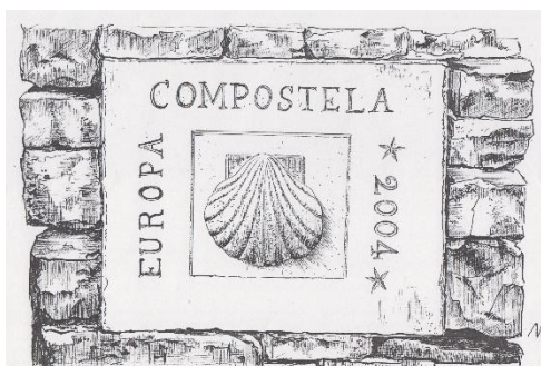
Pierre sculptée d'une coquille, dessin de Nicole Lamaille